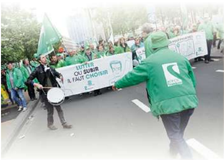
Lors de la manifestation Inter-syndicale du 24 mai 2016, 65.000 personnes revendiquent des services publics de qualité, des emplois décents et une fiscalité juste.

H et behoud van de winsten, met name in termen van lonen, en zorgen voor het behoud van de koopkracht is de prioritaire doelstelling van de vakbonden. In de 19 e eeuw vormen de lonen de kern van de spanning tussen werk en kapitaal. Werknemers zijn onderworpen aan de unilaterale beslissingen van werkgevers die de lonen reguleren volgens de economische situatie. De arbeidersbeweging verdedigt de vaststelling van de lonen, gezamenlijk besloten door de werkgevers en de stewards van de winkel.