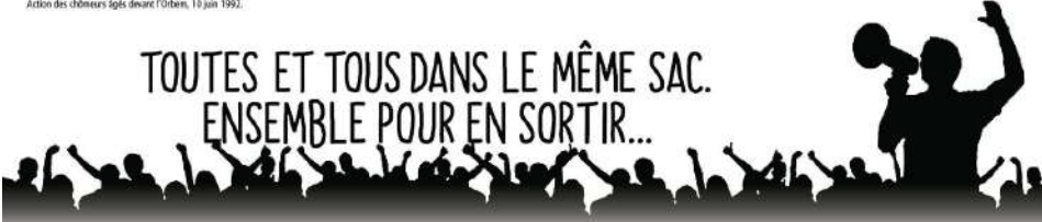
Journée mondiale de lutte contre la pauvreté, 2017.