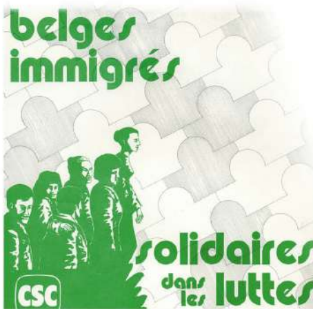
Une solidarité qu'on voit belge ou immigré, tel est le mit d'ordre des affiches de propagande de la CSC destinées à ses membres d'origine étrangère. Bruxelles, 1980.

de belangrijkste bron van inkomsten van de werknemers, door een uitkering te krijgen, en tot het einde van de 19 e eeuw willen werkloosheid erkennen als een inherent risico van het hulp te verlenen aan vakbondsworkloosheidsfondsen en door verplichte werkloosheidsverzekering. De Eerste Wereldoorlog de belangrijkste bron van inkomsten van de werknemers, door een uitkering te krijgen, en tot het einde van de 19 e eeuw willen werkloosheid erkennen als een inherent risico van het hulp te verlenen aan vakbondsworkloosheidsfondsen en door verplichte werkloosheidsverzekering. De Eerste Wereldoorlog