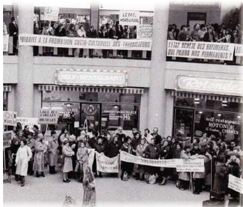
Manifestation dans la Galerie Ravestein de la section de l'Éducation Permanente en 1980, pour exiger l'application du décret et le droit de formation des travailleurs.

Après la Deuxième Guerre mondiale, l'éducation populaire laisse progressivement place à l'éducation permanente. Pour le mouvement ouvrier chrétien, la notion de « démocratisation culturelle » doit valoriser la culture pour et par tous, issue de l'expérience des individus. Des initiatives de formations d'adultes voient le jour. Un système de crédits d'heures selon lequel le travailleur obtient des congés destinés à la formation, sans perte de rémunération, est instauré en 1973 grâce notamment à l'action de la JOC et de la JOCF. Il est remplacé par le congé-éducation payé en 1985. Jusqu'à nos jours, l'analyse critique de la société et la stimulation d'initiatives démocratiques et collectives sont portées par les organisations du mouvement dans l'optique de promouvoir une société juste socialement et solidaire.