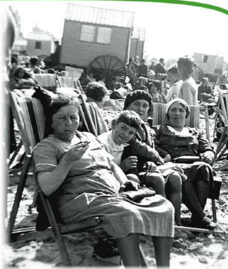
Les travailleurs obtiennent notamment la première semaine de congés payés après la grève générale de juin 1936.

Vanaf het einde van de 19 e eeuw ging de ontwikkeling van volkseducatie door de verovering van de arbeidersbeweging voor 'vrije tijd'. De strijd voor de vermindering van de arbeidstijd is gelokpeeld, voor de christelijke arbeidersbeweging, met de wens om deze «vrije tijd» een moment van vorming te maken, terwijl ze tegen het nietsdoen recht. Populair onderwijs moet de werknemer de opleiding kunnen geven die nodig is voor zijn emancipatie. Studiekringen zijn voor dit doel georganiseerd.