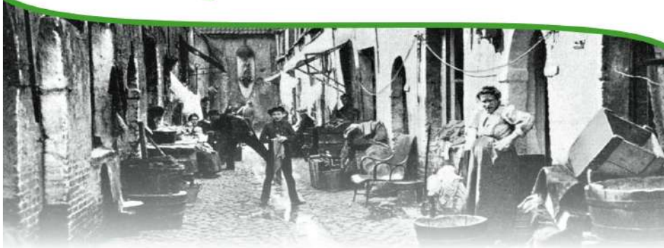
Une impasse insalubre comme il en existait des centaines à Bruxelles.

L'accès à un logement décent est un droit fondamental qui conditionne la santé et l'épanouissement socioculturel. Durant le 19 e et une partie du 20 e siècle, la lutte contre les taudis met en évidence le manque d'habitations à prix modéré et le besoin d'assainissement des logements.