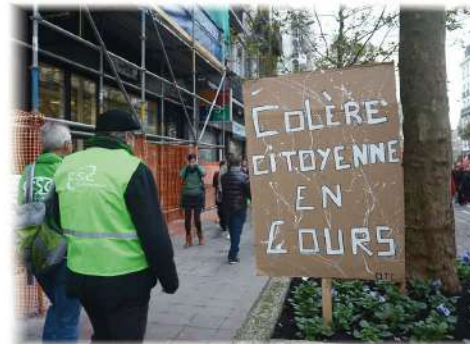
Manifestation nationale du 06 novembre 2014. Réunion contre la politique du gouvernement Michel Ier; 120.000 personnes ont tenu leur colère.

Om zijn financiën te saneren, kiest de staat voor een sociaal beleid dat de situatie van werklozen, eenoudergezinnen (meestal vrouwen), jongeren, ouderen, immigranten verslechtert. Emisseries rechten bieden niet de financiële bescherming die nodig is om waardig te leven. De sociale onderbescherming van mensen in precarie situaties, evenals het niet-gebruik van sociale rechten en diensten neemt toe. Christelijke arbeidersorganisaties van hun kant weigeren het beheer van de armoede in samenspraak met de staat te organiseren. Zij eisen hoogwaardige, duurzame banen, fatsoenlijke sociale uitkeringen en pensioenen, en sterkere en beter toegankelijke sociale rechten en diensten.