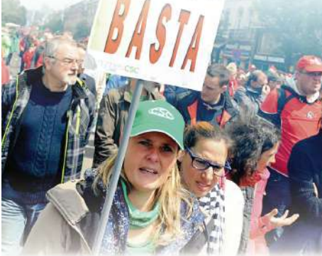
Les coupes budgétaires dans le domaine social touchent les femmes en majorité. Elles mettent de côté leur carrière pour s'occuper des enfants, ce qui impacte leur pension.

T egenover opeenvolgende regeringen die loonmatiging tot een essentiële factor in het concurrentievermogen van bedrijven uit de crisis van de jaren zeventig maken, verdedigen vakbonden de automatische koppeling van lonen aan de index als voorwaarde om de koopkracht te behouden. Vanaf de jaren tachtig tot heden ondernemen christelijke arbeidersorganisaties actie om deze inkomensbescherming te handhaven en een samenleving van welvaart en gedeelde veiligheid op een billijke manier te verzekeren.