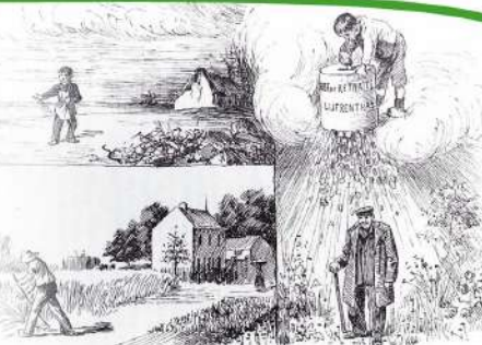
Il faut savoir pour réaliser sa vieillesse. Jusqu'en 1924, les pensions sont basées sur l'épargne personnelle. Aujourd'hui, les organisations ouvrières chrétiennes se mobilisent pour rendre la pension légale.

L'assurance vieillesse est promulguée en 1924 pour les ouvriers et en 1925 pour les employés. Elle devient la première assurance sociale obligatoire. Basée sur les cotisations des travailleurs, des employeurs et de l'État, elle représente une victoire pour le mouvement ouvrier.