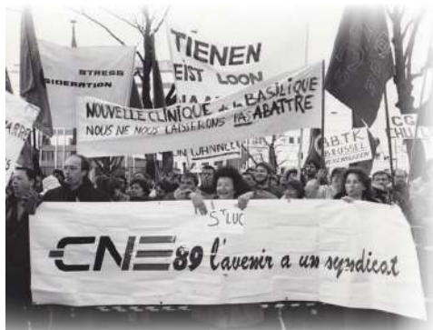
Manifestation en 1988 des secteurs des soins de santé organisée par le CNE à Bruxelles devant l'hôpital afin de réclamer une revalorisation du secteur.

Sociale ongelijkheid heeft ernstige gevolgen voor de gezondheid. Vandaag profiteert een kwart van de Brusselse bevolking van de toegenomen interventie voor de gezondheidszorg. De levensverwachting van inwoners van welgestelde gemeenten is drie jaar langer dan die van de armste gemeenten. Meer dan een kwart van de Brusselse gezinnen heeft de gezondheidszorg om financiële redenen al moeten uitstellen. Erkennend dat een slechte gezondheid en armoede elkaar wederzijds versterken, werken onderlinge maatschappijen samen om ongelijkheden op gezondheidsgebied tegen te gaan. Ze ondersteunen medische woningen, lobbyen om het sociale loon van derden te verhogen, bundelen hun krachten met eerstelijnsorganisaties om het publiek te informeren over de rechten die ze hebben op het gebied van vergoeding van zorg, onderhandelen en opleggen van medisch-wederzijdse welzijn patiënten.