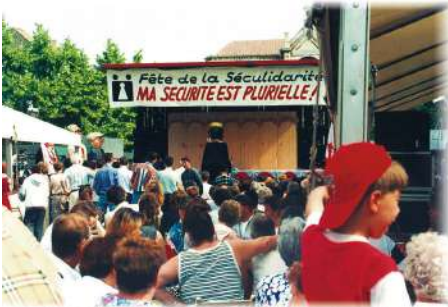
Fête de la Solidarité organisée par les EP en juin 1995, pour défendre la sécurité sociale et la solidarité.

Vanaf het begin claimt de arbeidersbeweging een verzekeringstelsel gebaseerd op solidariteit. Na decennia van worstelingen won hij de zaak met de oprichting van de « verzorgingsstaat » in 1944. Met de komst van sociale bescherming om sociale risico's te dekken (ziekte, handicap, ongeval, ouderdom, werkloosheid, gezinslading, enz.), is de veiligheid van het bestaan van mensen gegarandeerd. Het inkomen per hoofd neemt toe, de ongelijkheid neemt af. Armoede wordt verminderd zonder te verdwijnen.