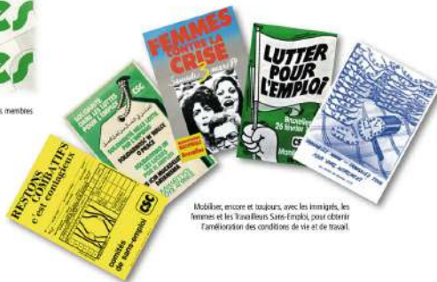
Mobiliser, encore et toujours, avec les immigrés, les femmes et les Travailleurs Sans-Franks, pour obtenir l'amélioration des conditions de vie et de travail.

Geconfronteerd met de jacht op werklozen die sinds 1974 is opgezet, organiseren werkloze activisten zich collectief om de situatie aan de kaak te stellen en hun rechten te verdedigen. Een ander fenomeen, hoewel loonarbeid lange tijd als het eerste bolwerk tegen armoede werd beschouwd, vervult het deze functie niet langer. Onzekere werkgelegenheid, deeltijdarbeid en sociale dumping bevorderen de terugkeer van een arme werkende klasse wiens salaris niet volstaat om waardig te leven. Het CSC neemt deel aan het antwoord door zijn filialen te mobiliseren, demonstraties en acties te organiseren om de politieke wereld uit te dagen en de wetten te veranderen.