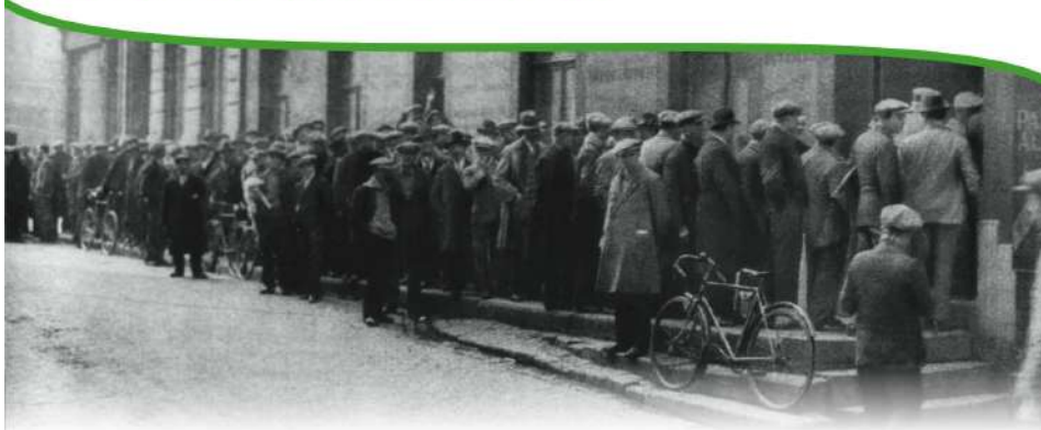
En 1933, la JOC aide les chômeurs et organise les Bourses du Travail Concordia.

Le salaire comme rétribution de la force de travail est la principale source de revenu des travailleurs. Les syndicats tentent de les prémunir contre la perte d'emploi par l'obtention d'une allocation, et jusqu'à la fin du 19 e siècle, veulent faire reconnaître le chômage comme un risque inhérent lié à une aide symbolique aux caisses de chômage syndicales et en assurance chômage obligatoire. La Première Guerre mondiale par deux crises économiques, le gouvernement instaure l'état de les étrangers en sont les principaux exclus. Grâce au mouvement pour tous en 1945.