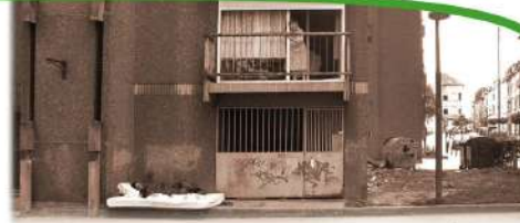
Logement social dans les Marolles, 53

Bruxelles compte 1,2 miljoen inwoners en is de rijkste regio van België, een rijkdom die niet alle inwoners treft. Een derde van de bevolking leeft van minder dan € 1.115 netto-inkomen per maand, de armoedegrens voor een alleenstaande in 2018. Steeds meer mensen hebben geen toegang meer tot sociale zekerheid of sociale bijstand.