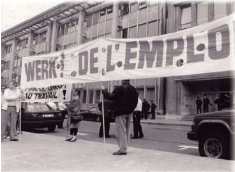
Action des chômeurs âgés devant l'Orbem, 10 juin 1992.

in de werkende leeftijd, vier jongeren onder de werkzoekenden. Meer jongeren en senioren waardoor ze waardig kunnen leven. Een kwart van de Brusselse kinderen jonger dan 18 jaar groeit op in een huishouden zonder inkomen uit werk. Het aandeel van de bevolking dat sociale bijstand of vervangingsinkomen ontvangt, met uitzondering van pensioenen, is hoog: 22,5% van de beroepsbevolking en 18% van de ouderen.