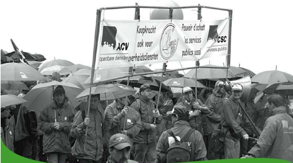
Le mécanisme de l'index est remis en question périodiquement: pendant les crises économiques des années 1930, les années 1980 ou, comme dans ce cas, en 1995.

La C.S.C. refuse de continuer à sentir les contraintes de salaires à l'index « corrigé » de gouvernement et public par le département des Affaires économiques. La C.S.C. a fait une déclaration dans ce sens au Conseil National du Travail.