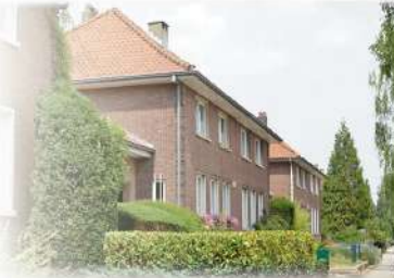
La Cité-jardin des Constellations à Woluwe Saint-Lambert, inaugurée en 1958, est directement issue de la volonté du MOC de favoriser l'accès à la propriété.

Sur base de la technique de l'enquête, un militant des Équipes Populaires établit le plan de sa rue afin de découvrir son quartier, puis met à l'action solidarité entre habitants. S&P