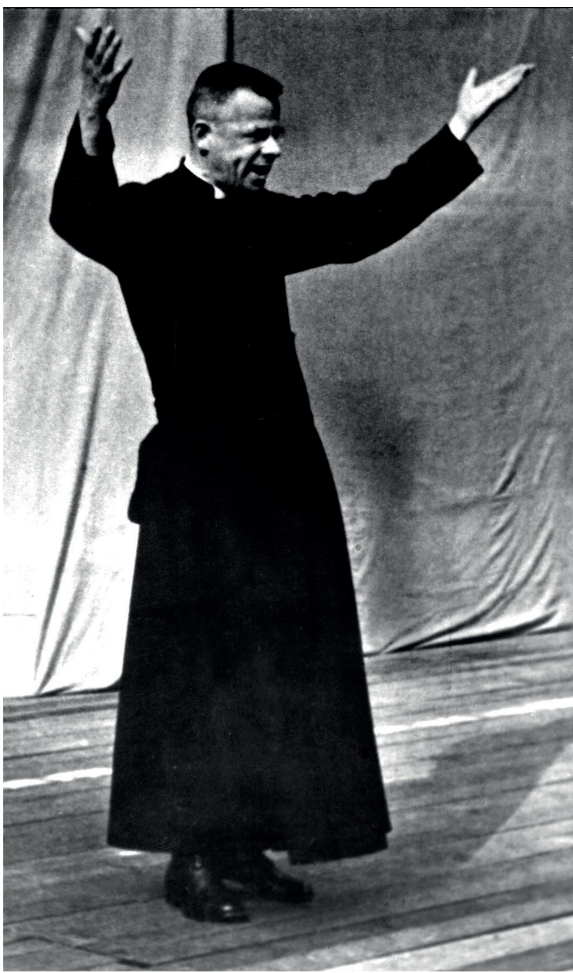
Intervention de Joseph Cardijn lors d'un congrès de la JOC Wallonne en 1933.